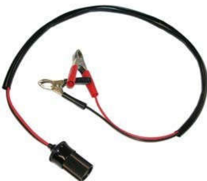
Adaptor de cablu