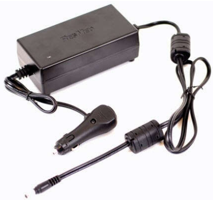
Convertor ResMed DC-to-DC (exemplu)